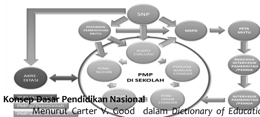
Gambar 1.1 Siklus Penjaminan Mutu Pendidikan

Sistem penjaminan mutu pendidikan dasar dan menengah terdiri atas dua komponen besar yaitu Sistem Penjaminan Mutu Internal dan Sistem Penjaminan Mutu Eksternal. Sistem Penjaminan Mutu Internal (SPMI) adalah sistem penjaminan mutu yang berjalan di dalam satuan pendidikan dan dijalankan oleh seluruh komponen satuan pendidikan. Sedangkan Sistem Penjaminan Mutu Eksternal (SPME) adalah sistem penjaminan mutu yang dijalankan oleh pemerintah, pemerintah daerah, badan akreditasi dan badan standarisasi. Sistem ini dijelaskan ada Pedoman Umum Sistem Penjaminan Mutu Pendidikan Dasar dan Menengah.